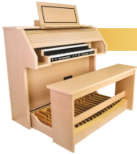
GRANDIOSO 341 T/R

3 Manuale, 61 Tasten mit Druckpunkt, 41 Register, Sub- und Superoktavkoppeln, Multi-User Setzersystem (8 x 999 Kombinationen), konkave Pedalklavatur, 30 Töne nach BDO oder AGO Norm, Pedal- und Notenbeleuchtung, internes Audiosystem: 6x60 Watt RMS, dimensionale Klangabstrahlung, Spieltischfinish Eiche hell, MDF, mit furnierter Rückwand und verschließbarem Rolldeckel